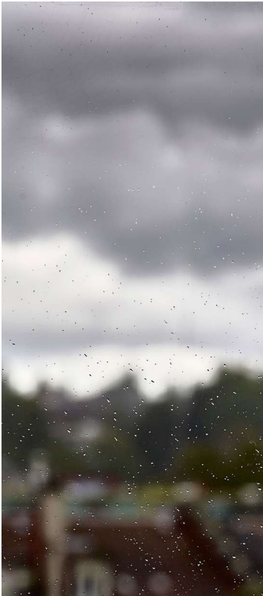
Kühleres Klima und kein Meer in der Nähe: Das sind die Gründe, warum die Atmosphäre in Bern nicht so viel Regen produzieren kann wie in Houston.

Das Mobiliar-Lab für Naturrisiken hat sich in letzter Zeit nun aber eingehender